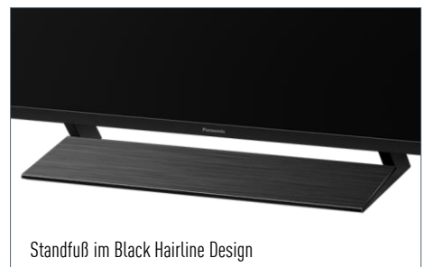
Standfuß im Black Hairline Design